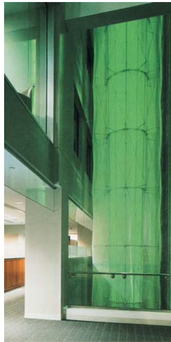
El difusor recorre el patio en toda su altura entregando luz natural a cada planta.

EL RETO de este proyecto consistía en poder transportar la luz natural a través del gran patio central de un edificio corporativo de 13 plantas, iluminando a su vez los espacios adyacentes y generando una espectacular caja de luz dentro del edificio. Para esto, los arquitectos Carpenter & Norris contaron con un heliostato LIGHTRON-BO-2100 fabricado por BOMIN-SOLAR de 4.41 m 2 de superficie reflectante que persigue el sol y lo refleja sobre un grupo de 9 espejos secundarios fijos. Estos espejos, situados en el extremo superior del patio, reflejan la luz hacia el interior, mientras que un gran difusor realizado en material textil la distribuye a lo largo del patio.