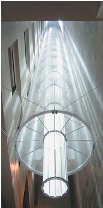
Vista del extremo del difusor textil diseñado por los arquitectos Carpenter & Norris