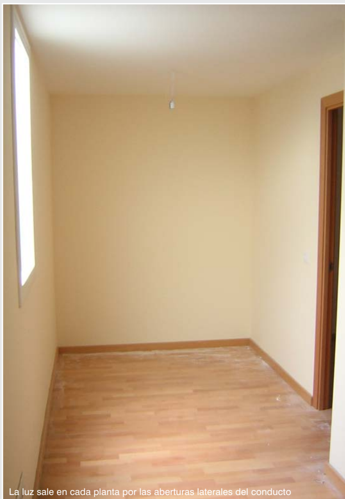
La luz sale en cada planta por las aberturas laterales del conducto