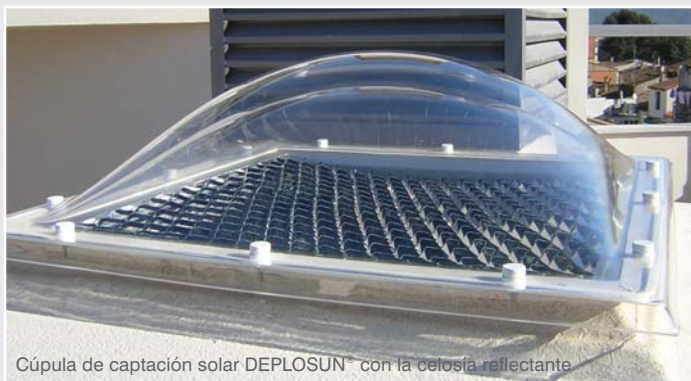
Cúpula de captación solar DEPOSUN ® con la celosía reflectante