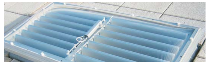
Los lucernarios con lamas motorizadas permiten un control total de la luz en el interior